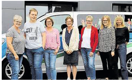
Gemeinsam für mehr Unterstützung Pflegebedürftiger: Hilter, Dissen und Bad Rothenfelde starten ein Pilotprojekt.

Der rechtliche Hintergrund: Alle Pflegebedürftigen mit mindestens Pflegegrad 1, die noch zu Hause wohnen, haben laut Sozialgesetzbuch Anspruch auf einen Entlastungsbetrag von bis zu 125 Euro monatlich. Dieser Betrag ist nicht identisch mit dem Pflegegeld. Vielmehr kann er ergänzend abgerufen werden – etwa für Angebote zur Unterstützung im Alltag durch sogenannte Nachbarschaftshelfer.