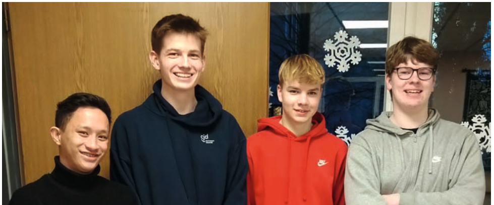
Die Teamer im Konfi