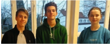
Die Teamer im Konfi