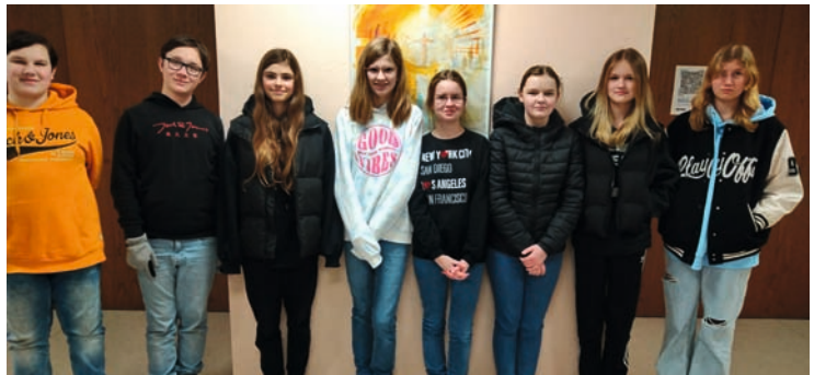
Konfirmation am 7. Mai