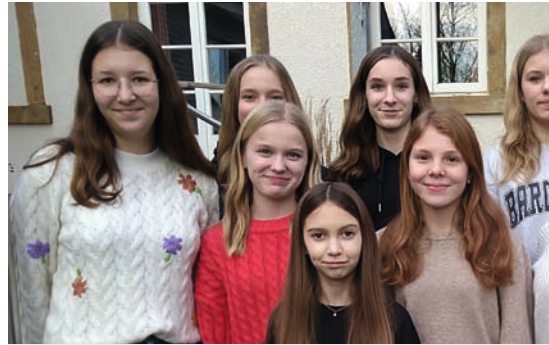
Konfirmation am 30. April