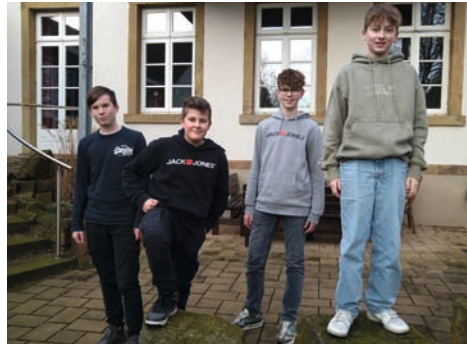
Konfirmation am 30. April